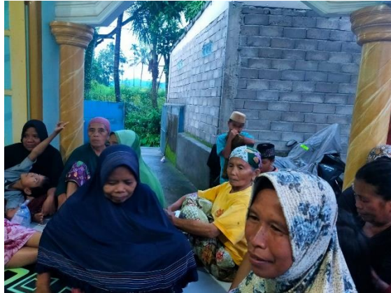
Gambar 1. Pemberian penkes tentang MPASI

Kegiatan penyuluhan kesehatan dan praktek pembuatan MP-ASI berjalan sesuai dengan tujuan. Meningkatnya pengetahuan, sikap dan perilaku ibu dalam praktek pembuatan makanan pendamping ASI (MP-ASI). Peserta yang hadir antusias terhadap kegiatan tersebut. Banyak pertanyaan yang diajukan oleh Ibu terutama cara pembuatan MP-ASI.