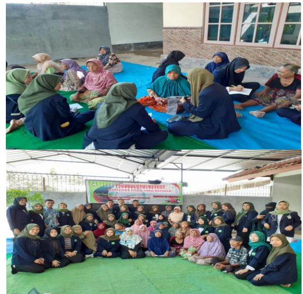
Gambar 1. Kegiatan Pengabdian

Tujuan kegiatan ini untuk mencegah terjadinya stroke, sehingga mampu membantu masyarakat untuk meningkatkan pengetahuan dan memaksimalkan dalam melakukan aktivitas sehari-hari dengan rasa aman. Latihan merupakan bagian dari proses rehabilitasi untuk mencapai tujuan tersebut. Latihan beberapa kali dalam sehari dapat mencegah terjadinya komplikasi yang akan menghambat pasien untuk dapat mencapai kemandirian dalam melakukan fungsinya sebagai manusia. Setelah pelaksanaan kegiatan pengabdian ini diharapkan pengetahuan masyarakat tentang stroke meningkat).