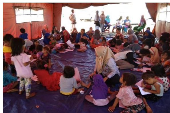
Gambar 1. Foto dokumentasi pengabdian